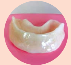
反対咬合治療装置

家族で協力し合って 「良い噛み方、良い歯並び、 きれいな顔立ち」 を目指して下さい。