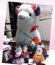
ミラパケッソンのクラレちゃん→